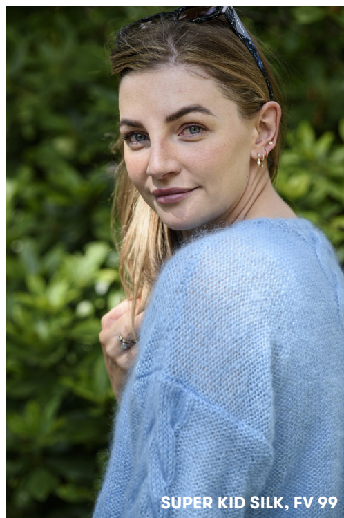
SUPER KID SILK, FV 99