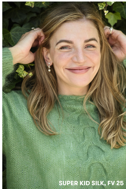
SUPER KID SILK, FV 25

— = Sæt 6 m på en hjælpep bagved arb , 6 r, strik m fra hjælpep ret.